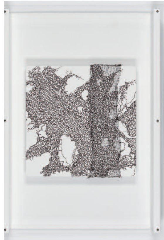
Die Künstlerin ist unglaublich vielfältig

Zeichnung bekommt gerade einen größeren Stellenwert in ihrer Arbeit.