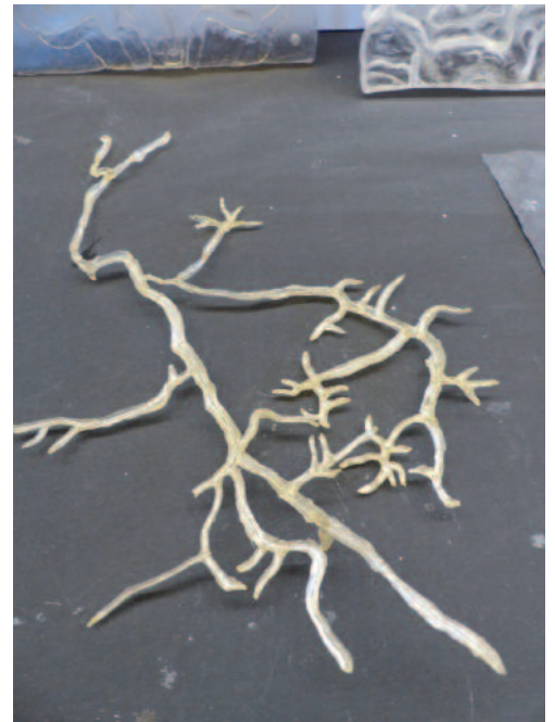
Ostrach und Nebenzweige Bild: Edith Reithmann

Das naheliegende Ostrachtal, ihre Heimat Fischen und die Oberstdorfer Berge – hier holt sich die gebürtige Allgäuerin Inspirationen.