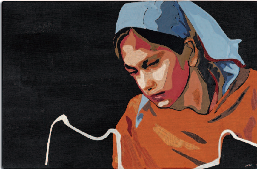
Publikumspreis im Rahmen der 65. Kunstausstellung der Allgäuer Festwoche

Parallel dazu geht es sozusagen back to the roots – zur Zeichnung „Die Linie ist das wichtigste Element für mich, auch Siebdruck mit Zeichnung zu kombinieren, finde ich interessant“. Die Unmittelbarkeit und Direktheit der