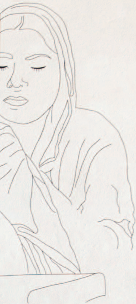
Temporäres Wandbild „ohne Titel“, 5 x 5 m, geklebt aus Tape-Band nur für eine Ausstellung